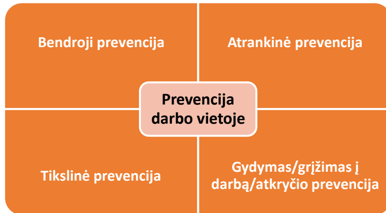
1 pav. Prevencijos darbo vietoje strategijos

Prevencija darbo vietoje skirstoma į keturias pagrindines strategijas (1 pav.), žemiau pateikiami atskiri jų ypatumai: