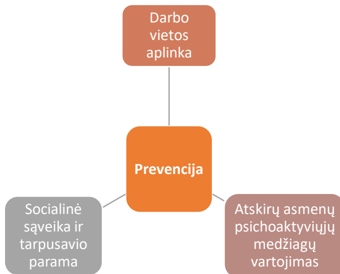
2 pav. Visapusiška prevencija darbo vietoje