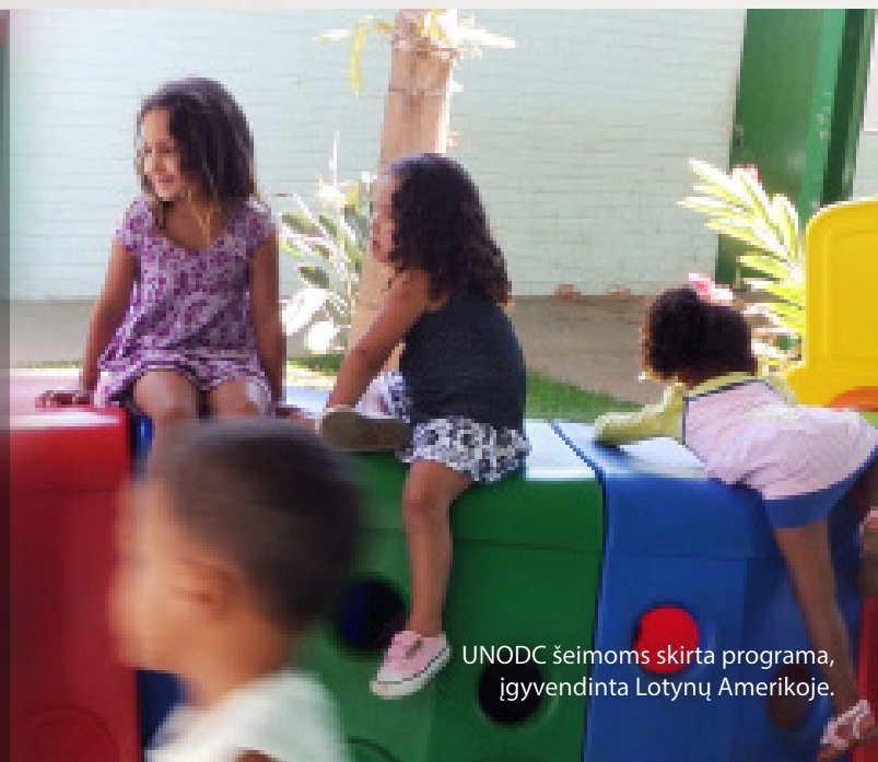
UNODC šeimoms skirta programa, įgyvendinta Lotynų Amerikoje.

- Mama, kuri su savo šeima dalyvavo UNODC šeimoms skirtoje programoje.